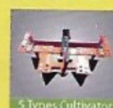
5 Tynes Cultivator