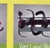
Wet Land Blades