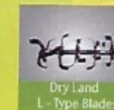
Dry Land L-Type Blades